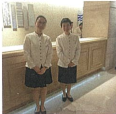
アオアヲナルリゾート

実習で色々なことを学び、将来、どんな仕事をしたいのかのヒントになりました！繁忙期で大変でしたが、お客様から感謝を頂いた時にやりがいを感じました！