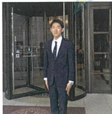
オリエンタルホテル

仕事に慣れるか不安でしたが社員の方に質問する度に丁寧に教えていただいたことが印象に残りました。客室の清掃やベッドメイキング、お客様のご案内をした時にやりがいを感じました。