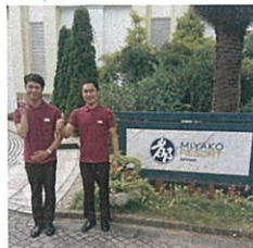
都リゾート志摩ベイサイドテラス

ホテルの裏側がどうなっているか、どうやってお客様が快適に過ごせるよう工夫しているかなど、いろいろなことが知れて良い経験になりました！