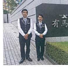
エクシブ有馬離宮

最初は緊張して食欲がなかったけど、社員さんたちが良くしてくださったので、楽しく実習を終えることができました！