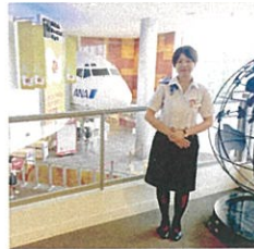
キッズニア甲子園