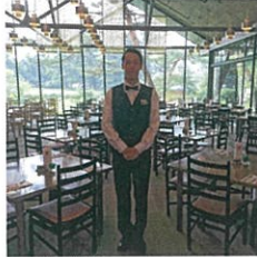
軽井沢プリンスホテル

働くことの厳しさや責任の重さを身にしみて感じた。同時にホテルで働くことの楽しさややりがいを感じることができた！