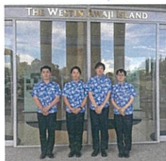
ウェスティンホテル淡路

初めてバーテンダーの方に会えたことが印象に残っています！人生で初めて会えたこともあり、とてもかっこよくて、いろいろ話も聞けてとても良い経験になりました！