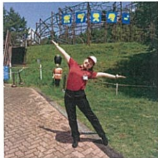
池の平ホテル&リゾート

先輩方がみなが優しくて面白くて、良かったです！たくさん学べて良い経験になりました！