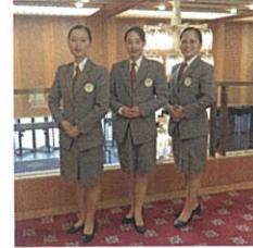
ホテルオークラ神戸

ベルとして実習をしました。お客様を部屋へ案内する時にお客様の要望に上手く応えられたり、道案内を上手に出来てお客様に感謝された時にやりがいを感じました！