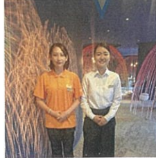
星野リゾートリゾナーレ熱海

様々な仕事をさせてもらい、責任を感じるが多かったですが、自分の知識が増えたと思います。特に自分の出来ないことや苦手な事を知れたのが一番良かったと思います。